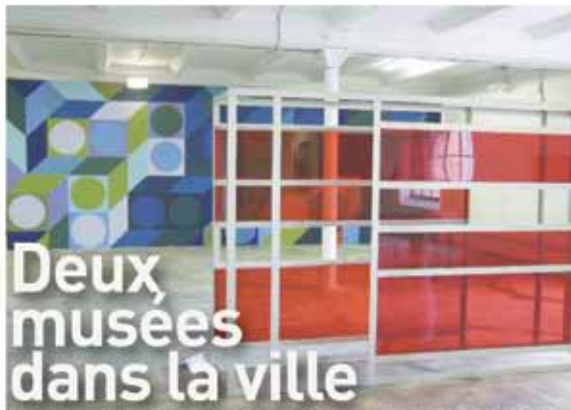
It's like a jungle... Matthieu Clairchard, Friche Belle de Mai/Triangle (vue partielle), 2010

PRINTEMPS DE L'ART CONTEMPORAIN | MUSÉE CANTINI