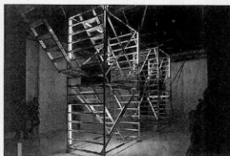
"Squelette", une performance de Fouad Bouchoucha à découvrir demain en ouverture aux Grandes Tables de la Friche.

L'an dernier, l'association a poussé le bouchon un peu plus loin en lançant un premier Printemps de l'art contemporain improvisé. La seconde édition, qui